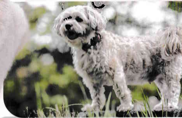
Maltez (Maltese Silky): o rasă cu aspect distinct și care învață foarte ușor, deosebit de populară în rândul doamnelor și domnișoarelor.

Ogarii, la fel ca și copoii de vânătoare, au fost alături de oameni încă de la începuturile vânătorii. Datorită abilităților lor deosebite, au reușit să hăituiască cu succes vânatul și să îl tragă la pământ. Întrucât acest „sport” este acum interzis prin lege, ogarii își pot dovedi îndemânarea doar participând la curse de ogari sau cucerind inimile stăpânilor lor ca animale de companie.